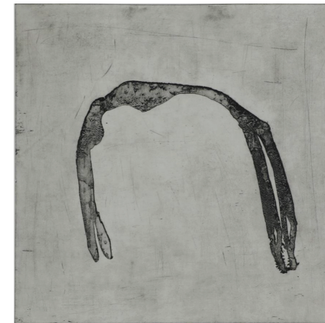
נות, תצריב ואקוטינטה, 50X50 ס"מ, 2018

הכניסה לשדה האמנות הפלסטית בשלב בוגר בחייה לאחר שעבדה שנים כפסיכולוגית קלינית, מתקשרת גם למטען אומנותי שספגה בבית אמה. את שפתה האמנותית פיתחה בזמן קצר יחסית. זאת לאחר לימודי תואר שני "אמן מורה" במכללת אורנים.