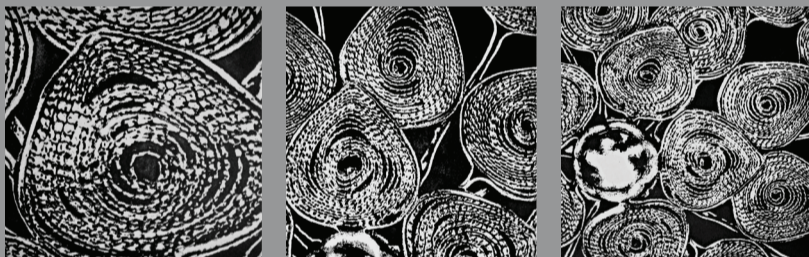
פיליגראן, תצריב צילומי ואקוויטינטה, 63x20 ס"מ

אמנית רב תחומית אשר מרבה לעסוק בהדפס רשת, תחריט, צילום, עיבוד טקסטיל, רקמה וציוה העבודות נעות בין הפיגורטיבי למופשט ומאופיינות במרקמי-משטחים דחוסים מהם מבליחים/נטמעים הדימויים השונים. הנושאים העיקריים בעבודה שלה נעים בין האישי לאוניברסאלי. היא בוחנת את דימוי הגוף השונה בדיוקנאות של בתה זהות וזיכרון בדימויי התכשיטים של אימא, משתמשת במרקמי טקסטיל לדימוי הברוש הישראלי ומנסת אותו, חוקרת את דימוי הלב ובוחנת את פירוקו הפיזי והסימבולי. ההדפס מאפשר עבודה בשכבות ויצירת וריאציות של הדימוי. היא משתמשת בטכניקות מגוונות בתחריט שכוללות את טכניקת התלחיץ המחדדת את תחושת הריק וצריבת הזיכרון. העבודות של גבעון מפגשות בין עולמות שונים של תרבות והן בעלות שפה אסתטית ייחודית.