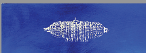
קמע, אמולסיה צילומית, 30x10 ס"מ