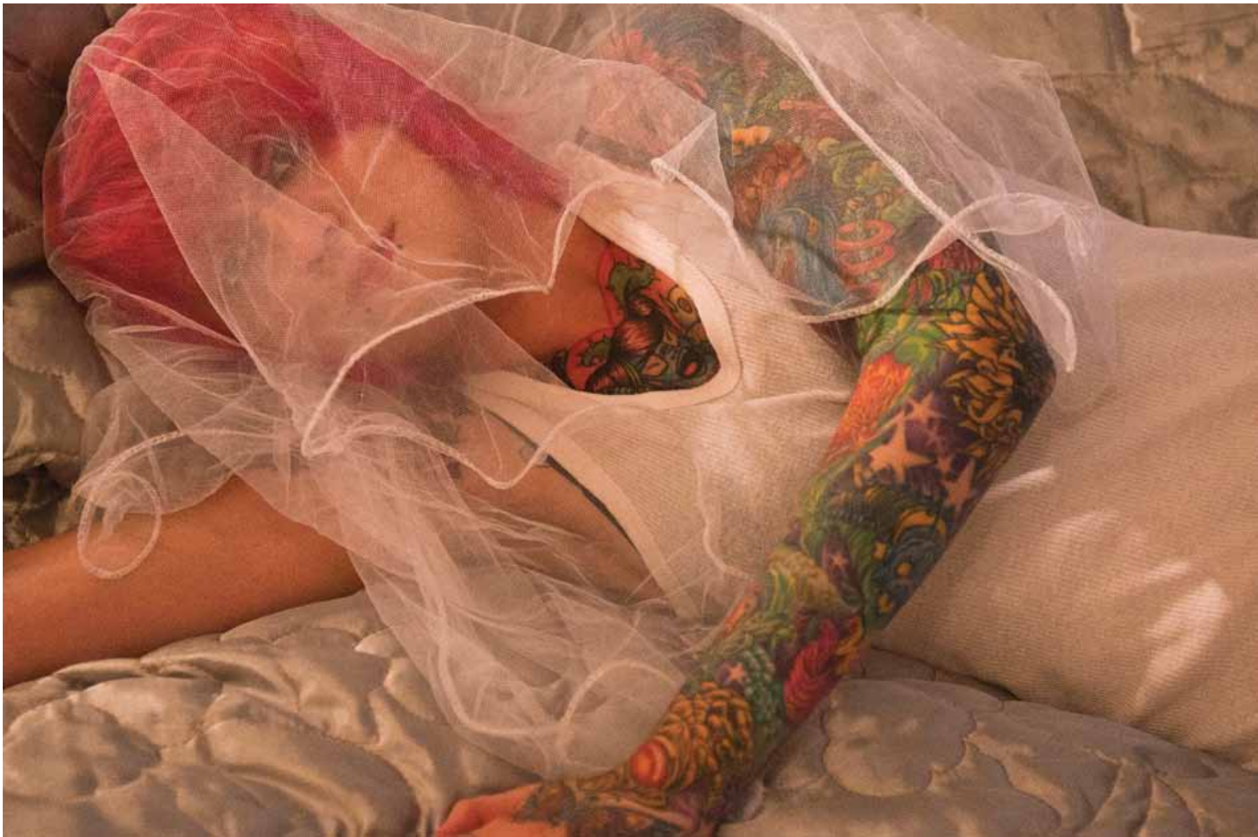
"MY HEART BELONGS TO DADDY" 2011, הדפסת למדה, 80/60 ס"מ