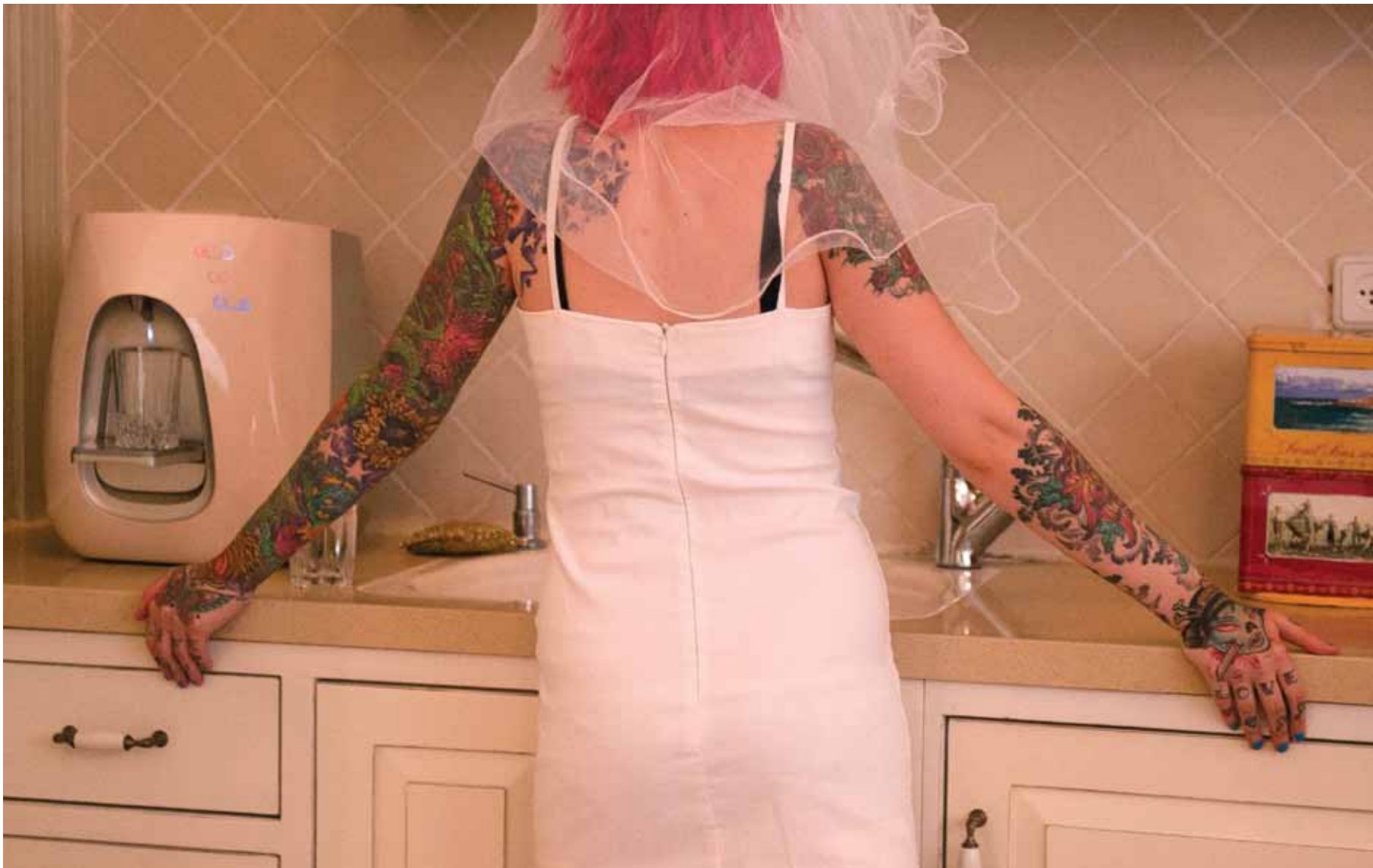
בעמוד הבא: "עיניים של אמה" 2010, הדפסת למדה, 80/60 ס"מ