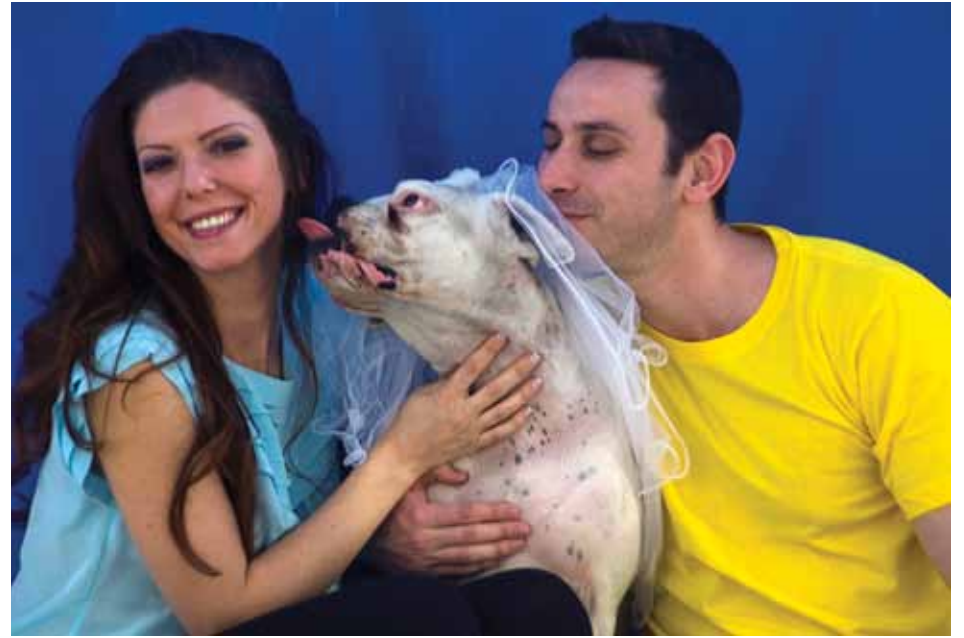
"לי - לי" 2010, צילום דיגיטלי, 100/80 ס"מ