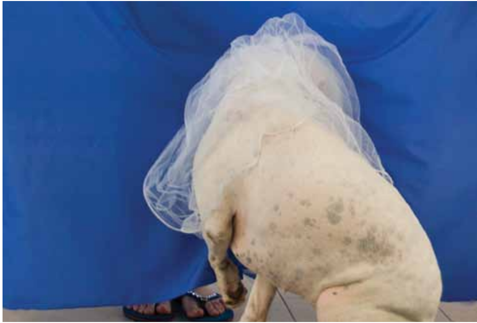
"לילי" 2010, צילום דיגיטלי