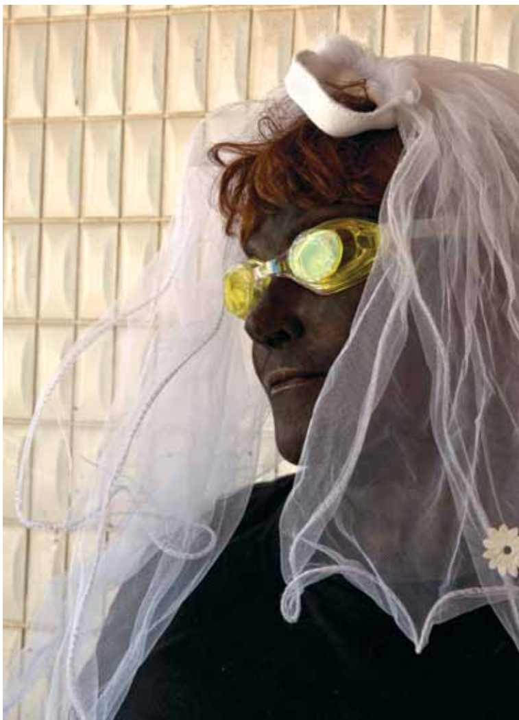
"עיניים עצמות לרווחה" 2011, צילום דיגיטלי