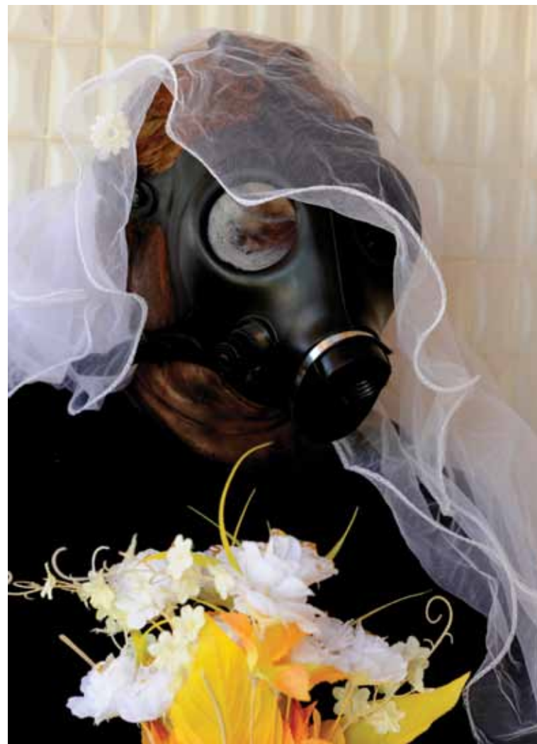
"כפרה שלי" 2011, צילום דיגיטלי