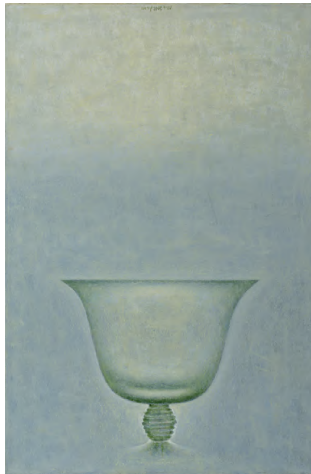
מאיר נטיף, ללא כותרת (2002), שמן על בד, 100/60 ס"מ