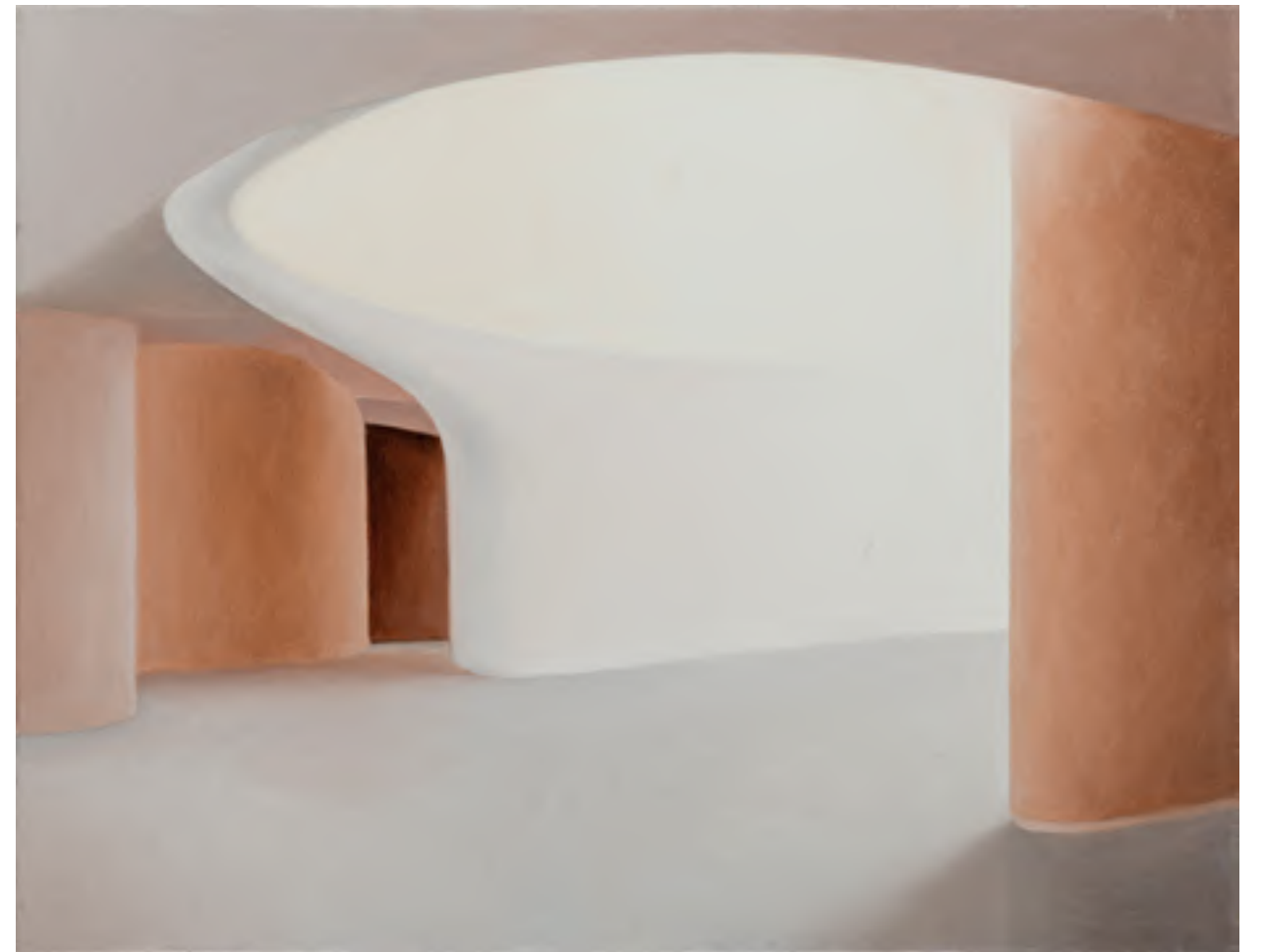
אורי ניר, תפנים (2018), שמן על בד, 40/60 ס"מ משמאל: מאיר נטיף, ללא כותרת (2007), שמן על בד, 50/60 ס"מ