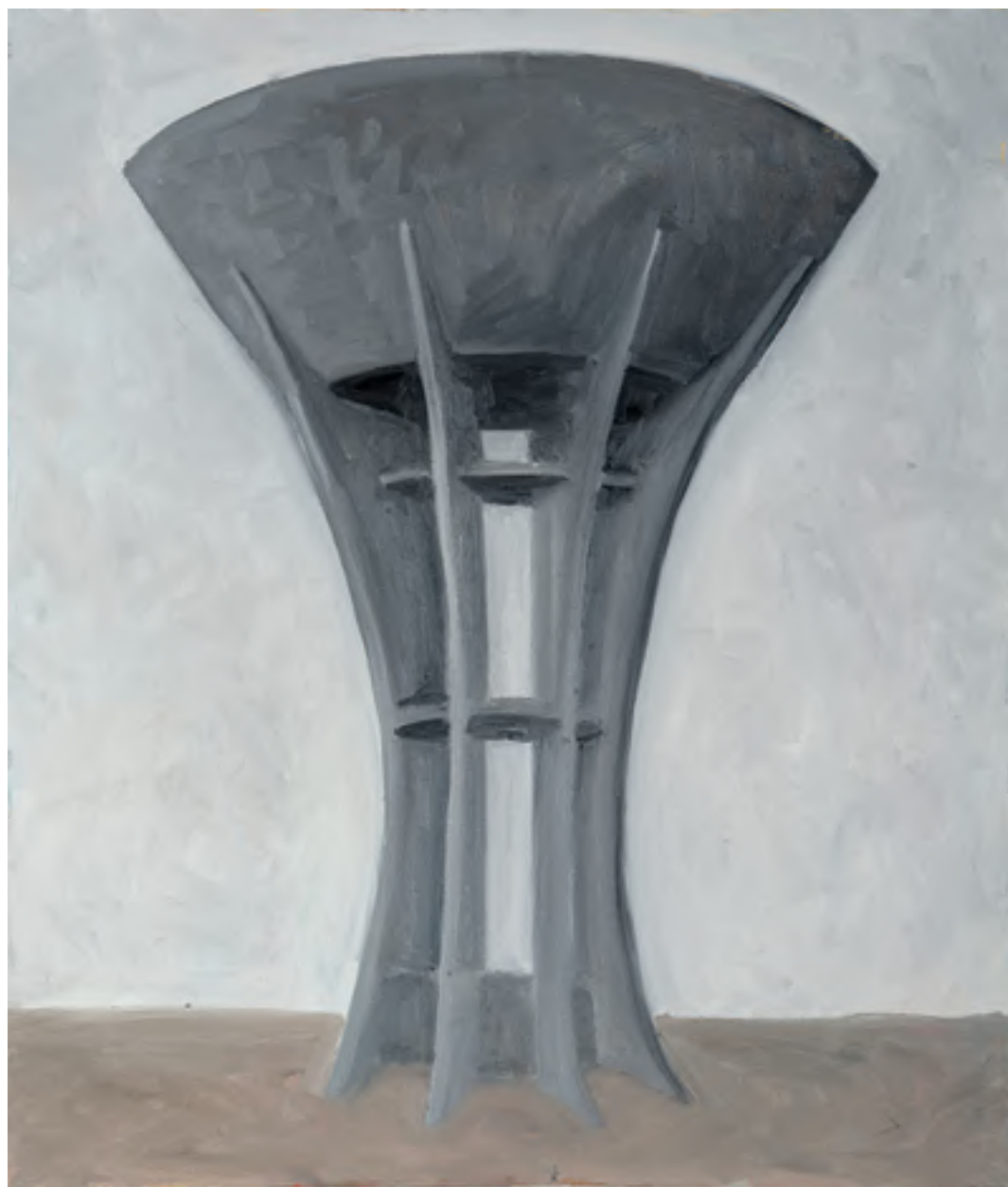
אורי ניר, מגדל מים (2017), שמן על בד, 60/40 ס"מ