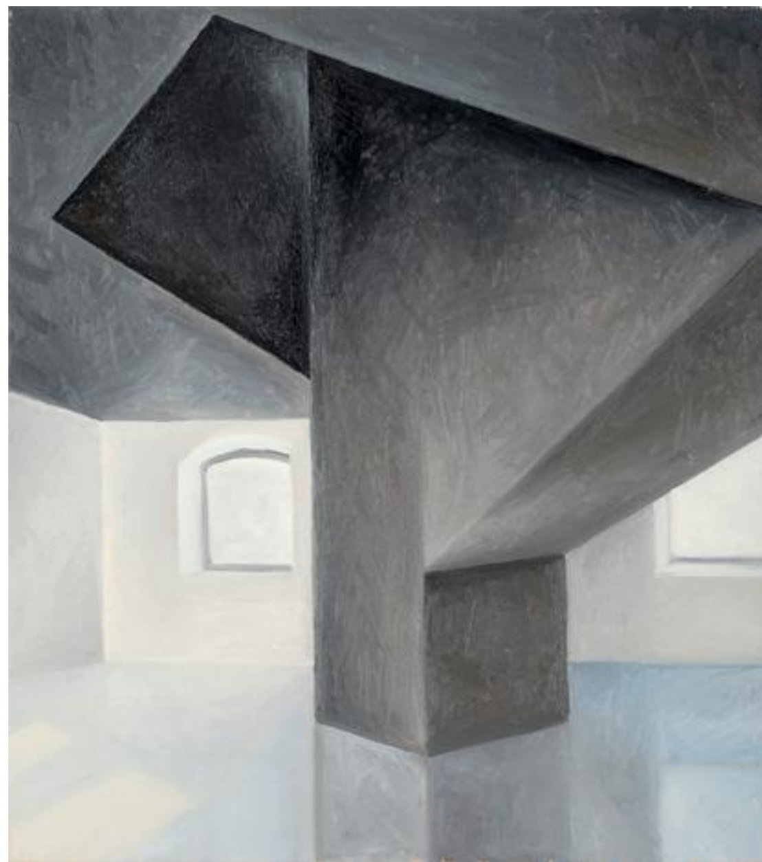
אורי ניר, תפנים (2013), שמן על בד, 45/35 ס"מ