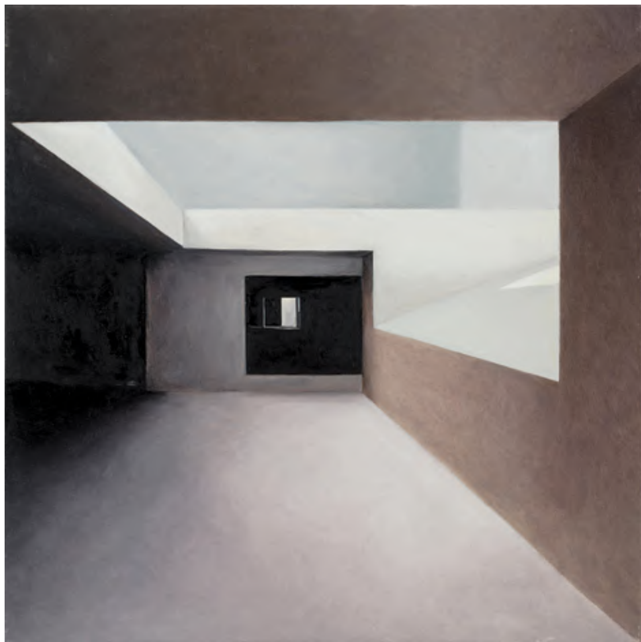
אורי ניר, תפנים (2017), שמן על בד, 50/50 ס"מ