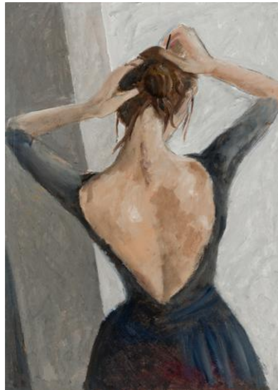
אורי ניר, אשה (2017), שמן על קרטון, 50/70 ס"מ