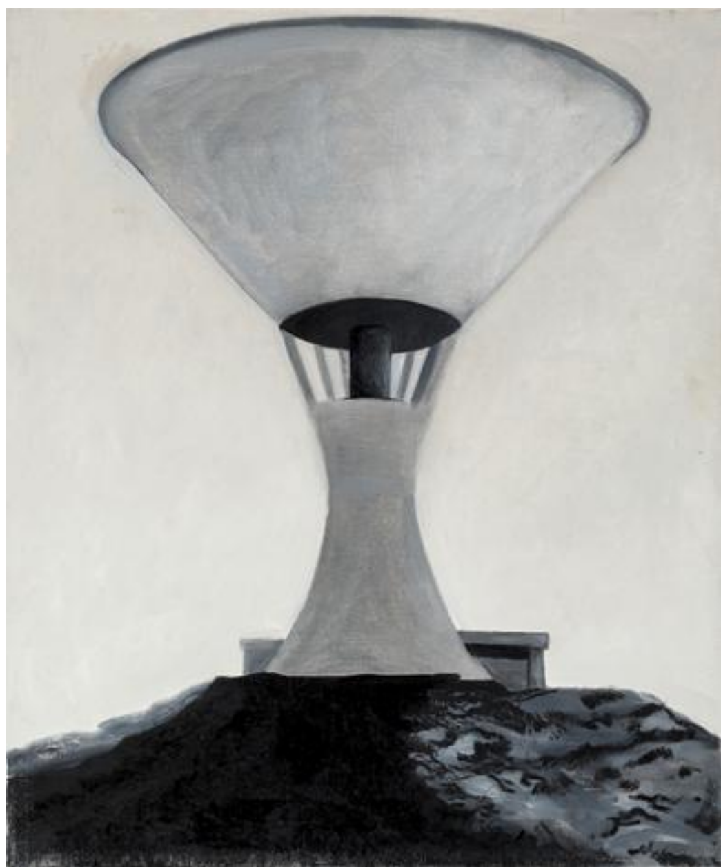
אורי ניר, מגדל מים (2017), שמן על בד, 60/40 ס"מ