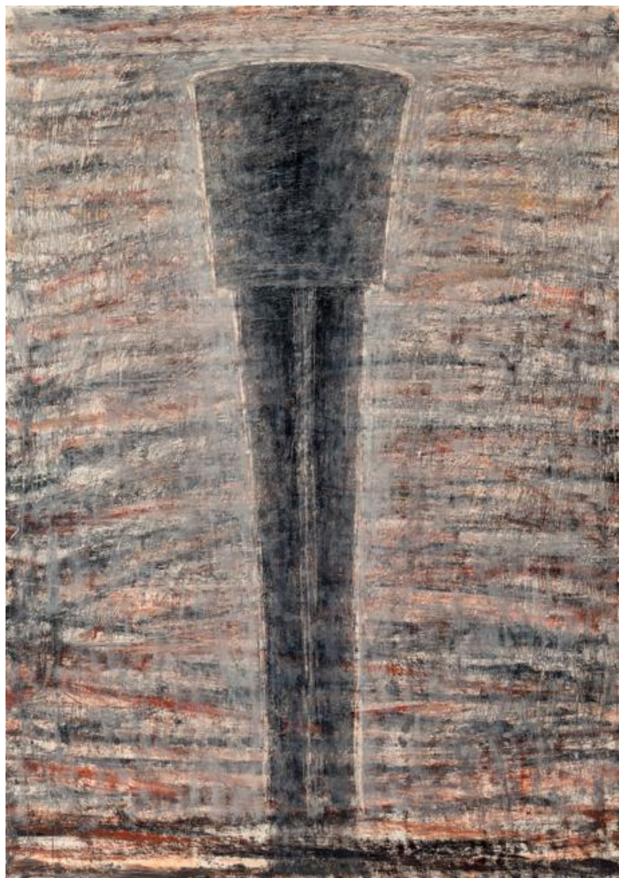
מאיר נטיף, ללא כותרת (1993), שמן על נייר, 100/70 ס"מ