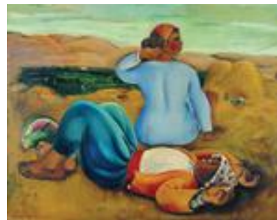
נחום גוטמן, מנוחת צהריים (1926), שמן על בד

הכדים הפואטיים של נטיף, מיצגים הלכירוח ומצבי נפש מרתקים. בצפייה ממושכת בהם, עלי־אף ולמרות הדמיון הרב ביניהם, ניתן למצוא שוני בין כד אחד למשנהו. השכבות הבונות את הכד חושפות מרקם משתנה וצבעוניות מגוונת, למרות הרזון והצמצום הצבעוני. קיים הבדל בין הכדים הראשונים שיצר נטיף בשנות יצירתו המוקדמות, לבין הכדים המאוחרים המוצגים בתערוכה הנוכחית. האחרונים הם גדולים, בעלי נפח, וממלאים בגופם את מרבית הבד. העמדה נפחית מסוג זה יוצרת