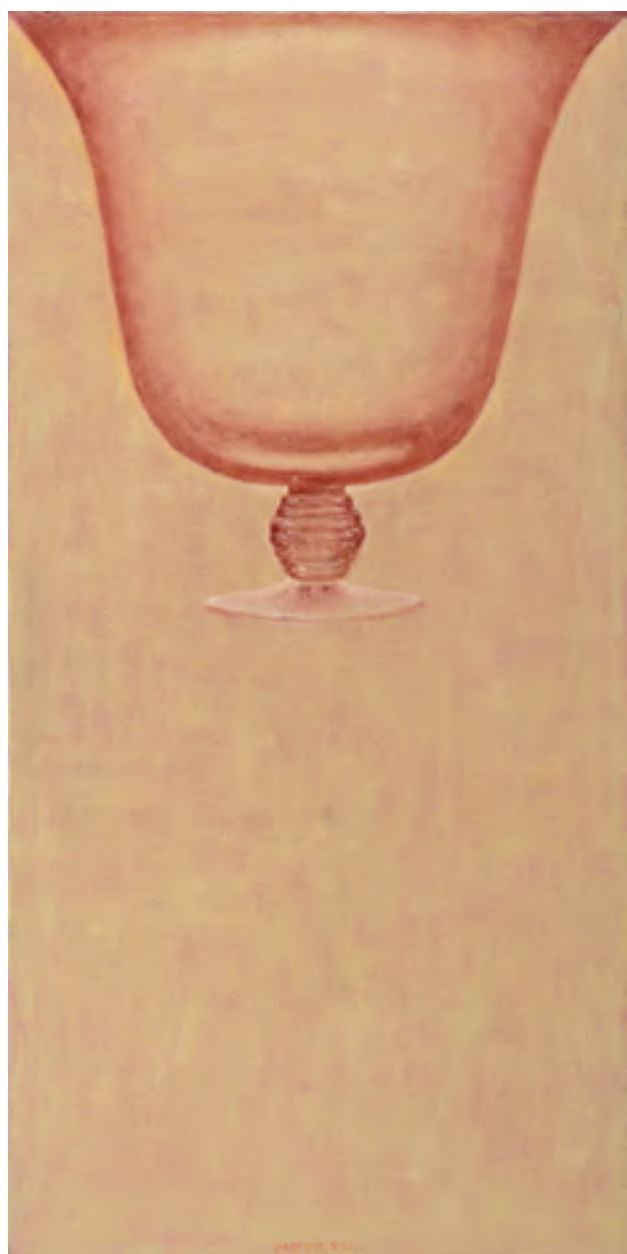
מאיר נטיף, ללא כותרת (2002), שמן על בד, 100/60 ס"מ בעמוד הבא מימין: מאיר נטיף, ללא כותרת (2007), שמן על בד, 50/60 ס"מ בעמוד הבא משמאל: אורי ניר, תפנים (2012), שמן על בד, 40/80 ס"מ