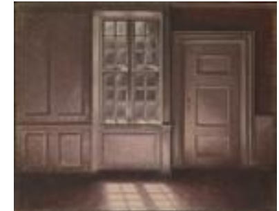
וילהלם המרשווי, אור ירח (1906), שמן על בד

מבנים , ניר מתבונן במבנים שמעניינים אותו, מצלם ומתרגם אדריכלות פנים לציור. הוא מוסיף או גורע חלקים במבנים הקיימים ויוצר בציוריו מבנים שאינם מזכירים בהכרח את המבנה המקורי. ציורי המבנים מגוונים, מתומצתים ברובם ובדרך כלל מונוכרומטיים בגוונים רכים. החללים אמנם מנוכרים אך מעוררים התרגשות, בזכות היופי והאור הרב שמציף אותם. ניתן לראות בהם צורות גיאומטריות מאסיביות שעולות זו על זו, מעצימות את החלל ולעיתים סותמות אותו. בנוסף למבנים המופשטים הוא מצייר מבנים בהם מעטרות קשתות את פנים המבנה, והן מוסיפות לחלל הריק תוכן ועניין. יש לציין כי ברוב המבנים הדימוי האנושי נעדר. ניר מספר כי ציוריו מושפעים מהאמן הדני Vilhelm Hammrshoi שמזכיר במעט את התפנימים שלו, אלא שבצפייה בחלק מציוריו של Hammshoi הדמות האנושית חמורת סבר, האווירה קודרת