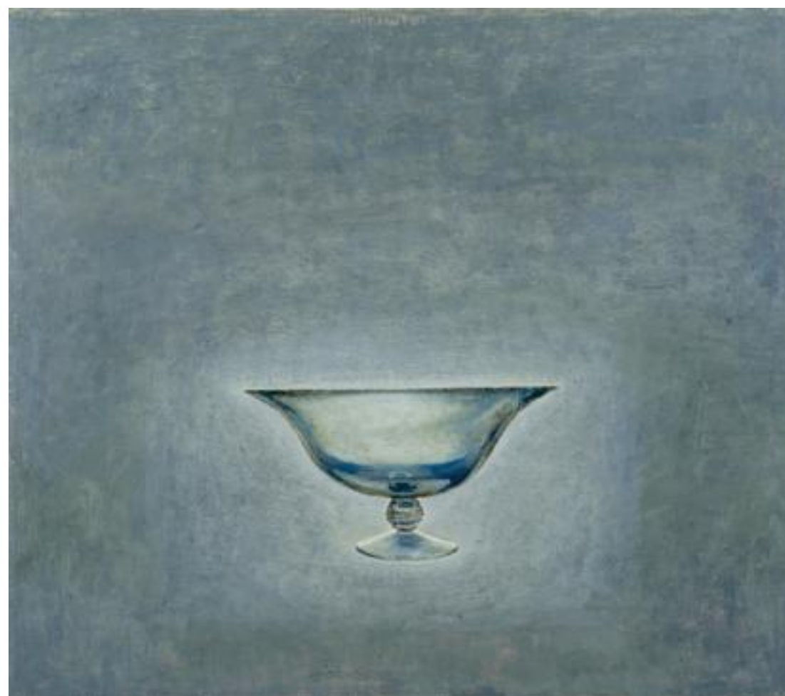
מאיר נטיף, ללא כותרת (2002), שמן על בד, 80/69 ס"מ