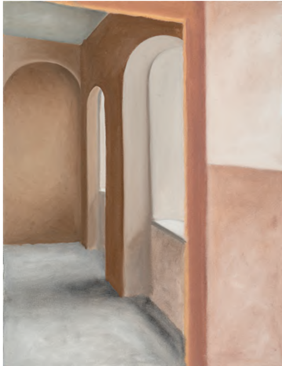
אורי ניר, תפנים (2018), שמן על בד, 60/40 ס"מ

ציוריו של אורי ניר , בדומה לאלה של מאיר נטיף, מתאפיינים בקו נקי, אסתטי, בתמצות וצמצום. ציוריו מתאפיינים בטקסטורה עדינה ומהוקצעת ובמעברים צבעוניים וטונאליים הדרגתיים. בתערוכה זו מוצגות מספר סדרות: מבנים, מגדלי מים ונשים.