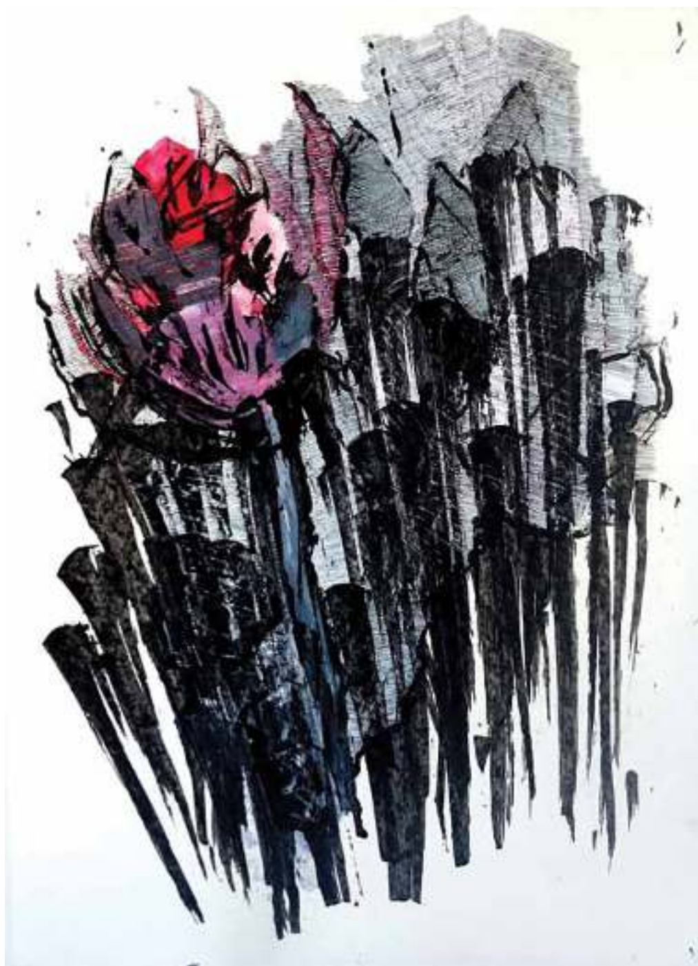
גגה יודקוביץ עצינוי, מתוך הסדרה: פרחי יום הזיכרון, 2011, טכניקה מעורבת, 70/100 ס"מ בעמוד הסמוך: טכניקה מעורבת, 75/70 ס"מ