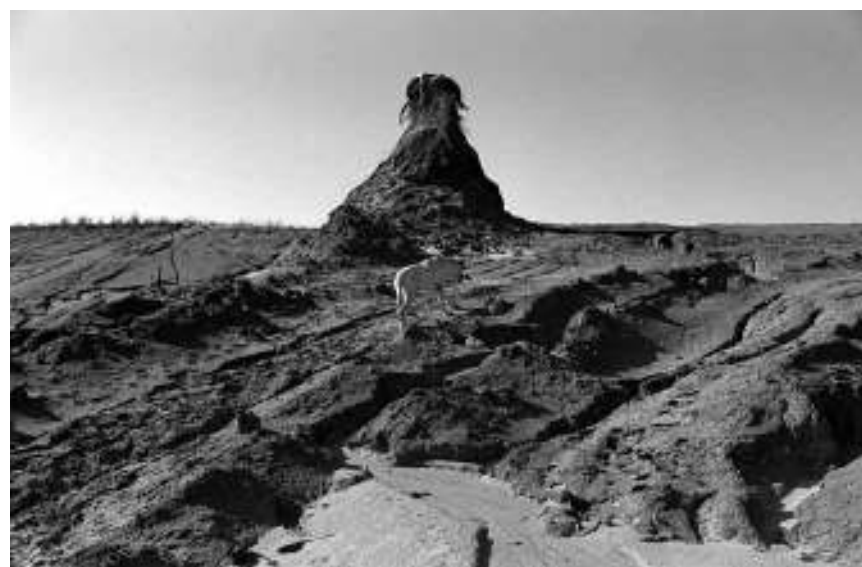
פסי גירש, סוף העולם, 1993, הדפס כסף, 65/98 ס"מ ; על הבמה בתל גזר, 1989, הדפס כסף, 65/98 ס"מ