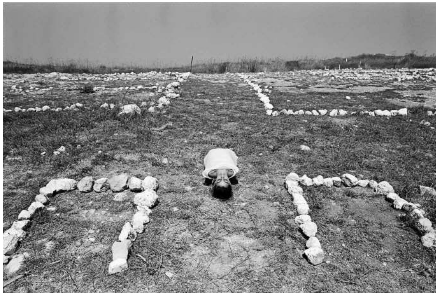
פסי גירש, מחנה צבאי נטוש, 1989, הדפס כסף, 65/98 ס"מ