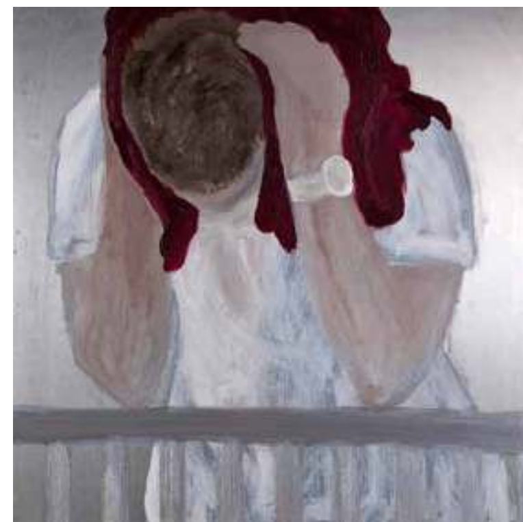
חנה יגור, ללא כותרת 2009, שמן על פח, 60/60 ס"מ ; ללא כותרת 2008, שמן על בד, 100/100 ס"מ