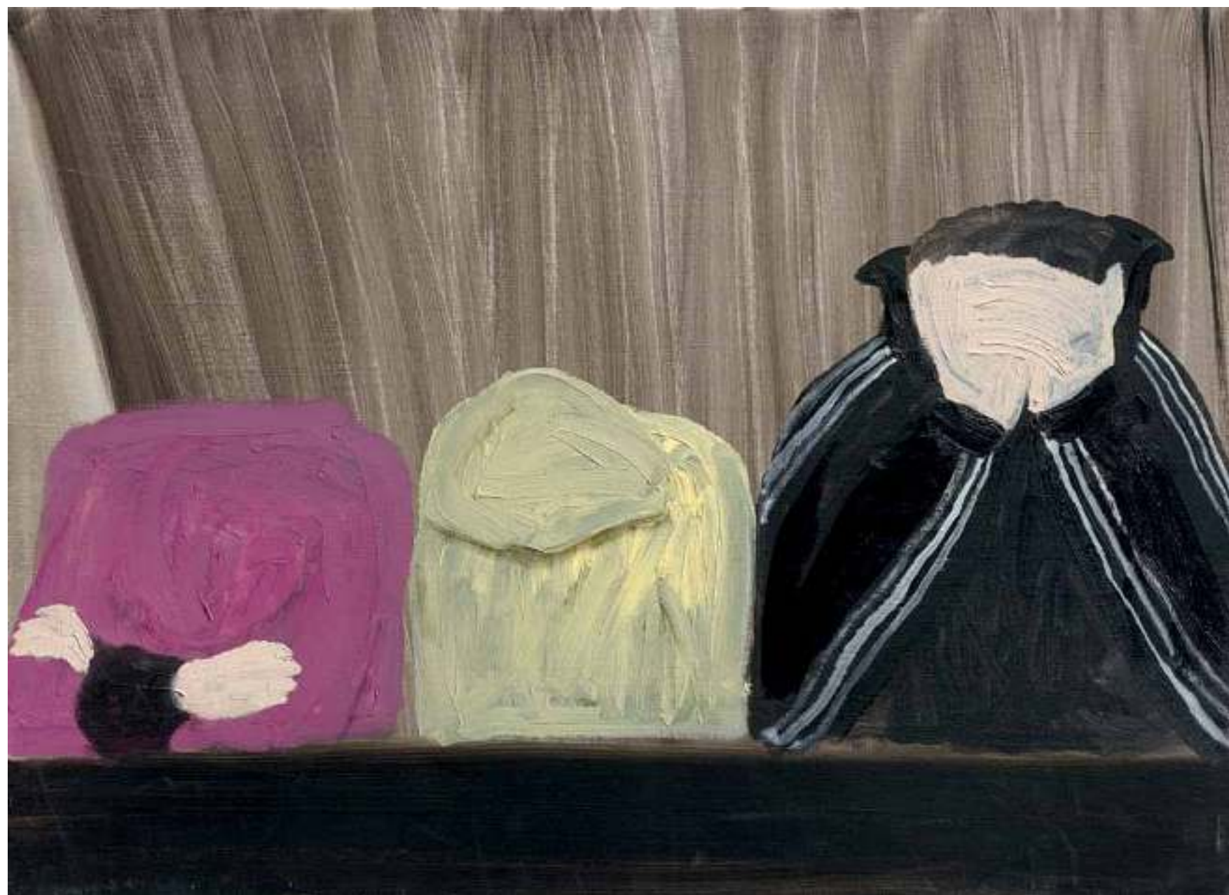
חנה יגור, ללא כותרת 2009, שמן על בד, 50/60 ס"מ