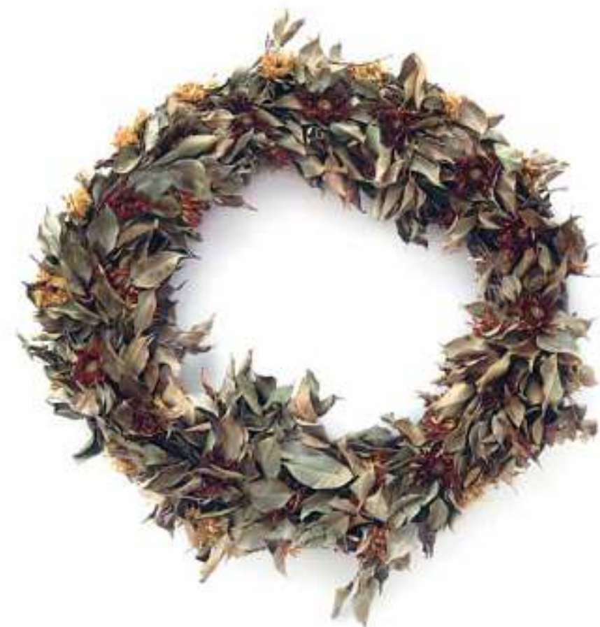
עדי ברנדה, 2007 Two Weeks Later 1 ; 2007 Two Weeks Later 2 ; 2007 Two Weeks Later 3 ; לאה גולדברג 2007, הדפסות צבע, 80/80 ס"מ