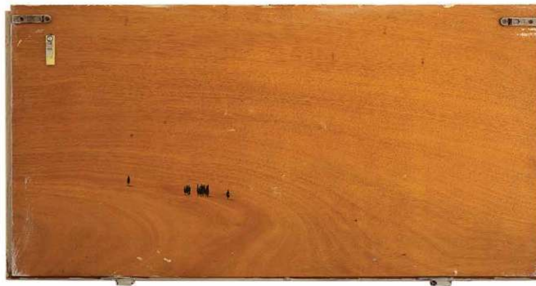
דרור אוסלנדר, "ברושים" 2009, שמן על דלת מטבח 82/41 ס"מ ; בעמוד הסמוך: "ללא כותרת" 2009, שמן על נייר פרמנט 45/30 ס"מ