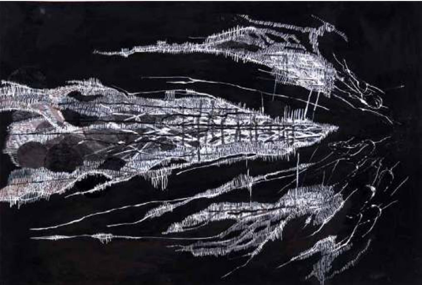
נגה יודקוביק עיצוני, מתוך הסדרה: פרחי יום הזיכרון 2011, טכניקה מעורבת, 70/100 ס"מ